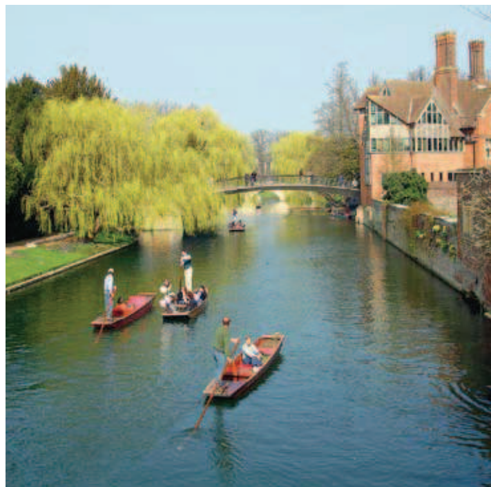
Der Cam

Das Schulgebäude besteht aus viel Holz und Glas, somit schafft es eine warme, gemütliche Atmosphäre. Es gibt 20 Klassenzimmer, eine Aula, eine Cafeteria und eine schöne Terrasse. WLAN ist verfügbar. Bis zum Zentrum der traditionsreichen Universitätsstadt sind es knapp 15 Minuten zu Fuß.