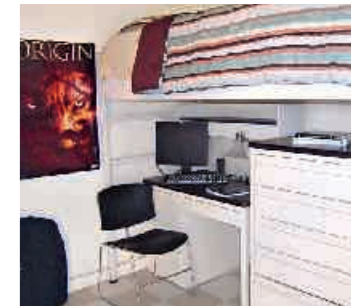
Wohnbeispiel, AI Studentenresidenz