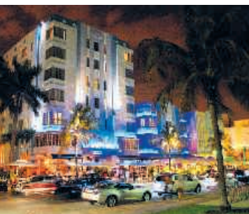
Fort Lauderdale bei Nacht