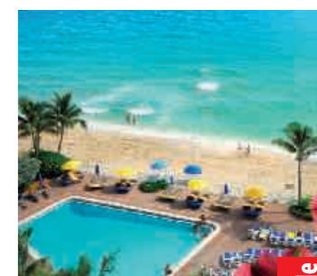
Ocean Sky Hotel & Resort

Neu: Studentenresidenz des Art Institutes of Fort Lauderdale