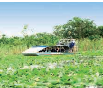
Everglades Nationalpark Airboat Tour