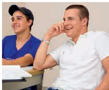
Lernen in angenehmer Atmosphäre