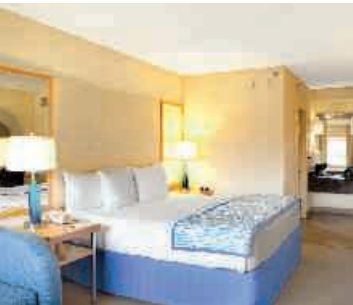
Hotel La Quinta, Wohnbeispiel