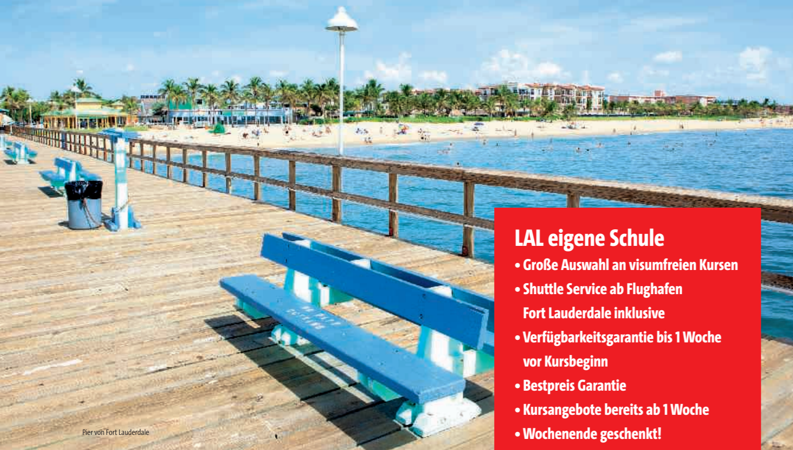
Pier von Fort Lauderdale