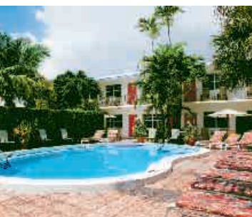
Shore Haven Resort