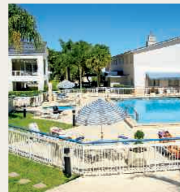
LAL Fort Lauderdale