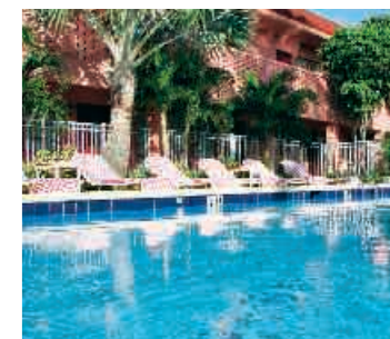
The Away Inn