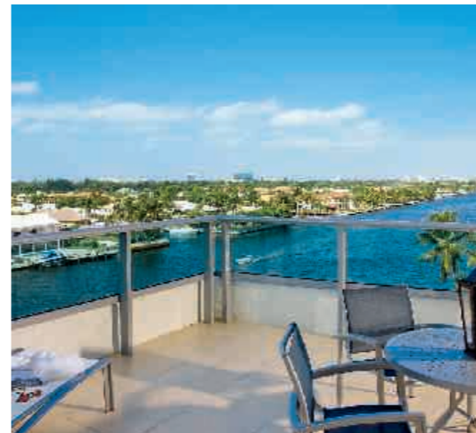
Il Lugano Suite Hotel

Jeder Unterkunftstag wird nach der jeweiligen Saison berechnet. 1. Woche = 7 Nächte, VL Woche = 7 Nächte, VL Wo = Verlängerungswoche Zu bestimmten Terminen sind Zimmer nur zu erhöhten Preisen buchbar. Erkundigen Sie sich auch nach unseren tagesaktuellen Angebotspreisen. Ihr Reisebüro oder unser Beratungsteam berät Sie gern.