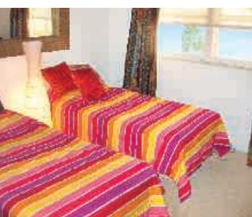
Student Apartment, Wohnbeispiel

Die Schule befindet sich in einem Flügel des Hotels La Quinta