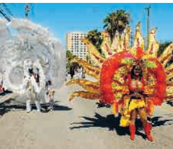
LAL Fort Lauderdale Carnival