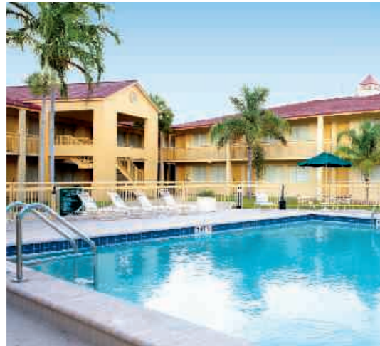
Hotel La Quinta

Privatunterkunft: Zu Gast in einem amerikanischen Privathaushalt