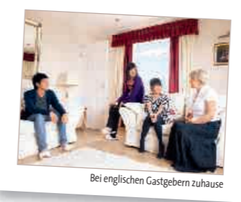
Bei englischen Gastgebern zuhause