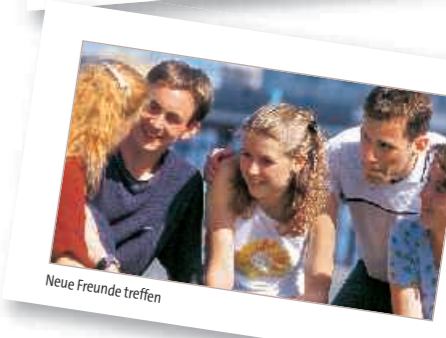
Neue Freunde treffen

Für Familien empfohlen! Siehe nächste Seite.