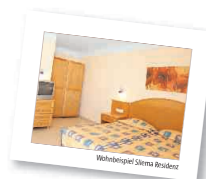
Wohnbeispiel Sliema Residenz

Hinweis: Eure Betreuer wohnen mit Euch in der Residenz und sind somit rund um die Uhr für Euch erreichbar.