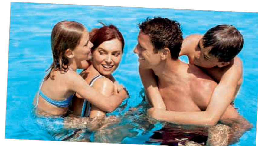
Spaß und Spiel im Pool

Warum trennt Urlaub machen, wenn es zusammen viel schöner ist? Auf der sonnigen Mittelmeerinsel Malta bieten wir individuelle Sprachprogramme sowohl für Schüler von 8 bis 17 Jahren, als auch für Erwachsene an. Der Unterricht erfolgt in den LAL Malta Schulgebäuden in Sliema, die ca. 10 Gehminuten voneinander entfernt liegen. Sie besuchen getrennte Klassen, abgestimmt auf die jeweiligen Anforderungen. Die Eltern können aus unserem reichhaltigen Angebot an Sprachkursen für Erwachsene auswählen (s. S. 94 oder LAL Katalog für Erwachsene ab S. 24). Die Kosten für Schülersprachkurse ohne Unterkunft und Transfer lauten: Standardkurs & Freizeitpaket Saison A Saison B 1 Woche 241 263 2 Wochen 358 460 VL Woche – 197 Aufpreis Juniorenkurs & Freizeitpaket: € 25 pro Woche. Da die Erziehungsberechtigten als Aufsichtspersonen dabei sind, können die Kinder von dem im Schülerpaket inkludierten Aktivitätenprogramm befreit werden. Die Ermäßigung für den Standardkurs ohne Freizeitpaket auf die oben genannten Preise beträgt € 48 pro Woche. Familienmitglieder können auch ohne Sprachkurs mitreisen. Wir erstellen Ihnen gerne ein individuelles Angebot für die ganze Familie gemäß Ihren speziellen Anforderungen und Wünschen. Fragen Sie uns!