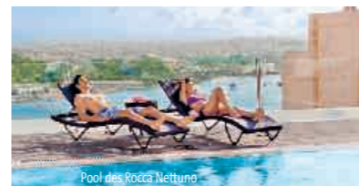
Pool des Rocca Nettuno

Jeder Unterkunftstag wird nach der jeweiligen Saison berechnet. 1. Woche = 7 Nächte, VL Woche = 7 Nächte