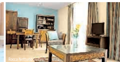
Rocca Nettuno Suites