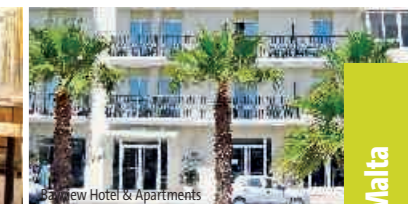
Bayview Hotel & Apartments

Betreute Schülersprachreisen all inclusive! Bei den LAL Schülersprachreisen erhalten Sie alle Leistungen aus einer Hand. Siehe Seite 6.